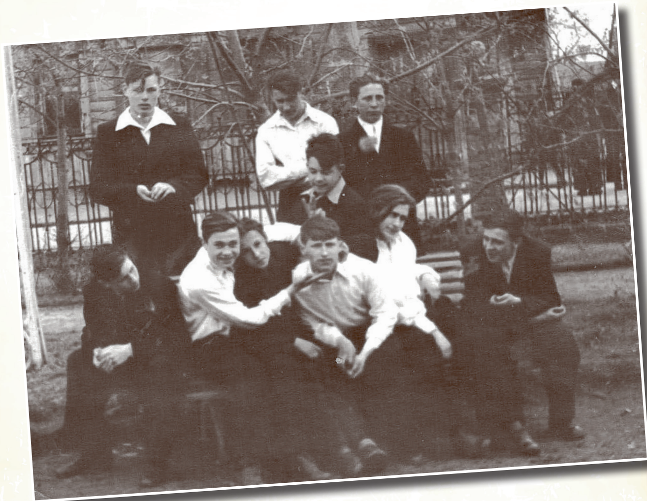
После демонстрации. 50-е гг.