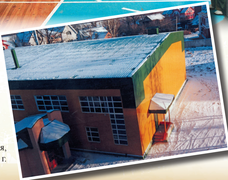
Спортзал лица, построенный в 2004 г.