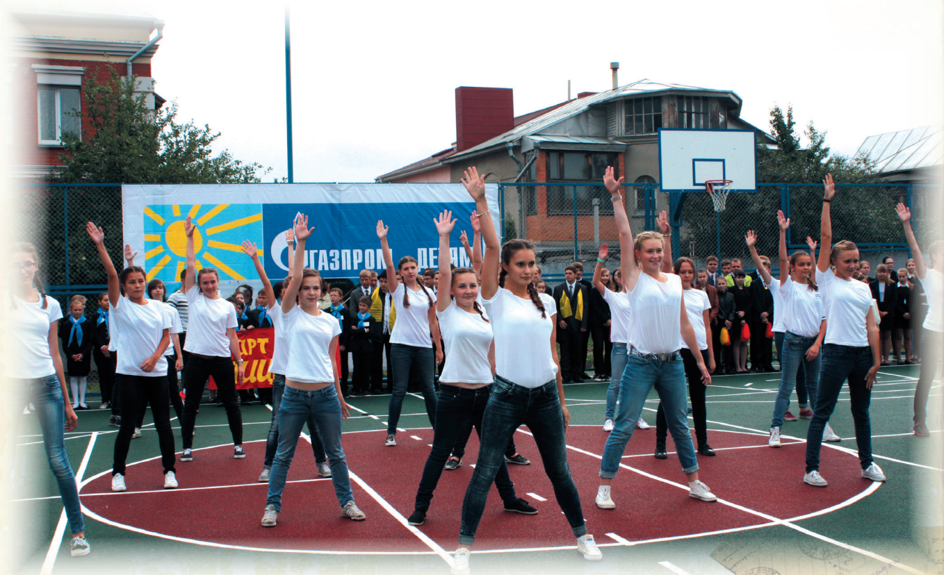
Спортивная площадка лицея. Сентябрь, 2014 г.

Наш школьный сад и стадион съели годы перестройки. Большая часть школьного двора ушла на усадьбы частных коттеджей. Было бы справедливо, чтобы эти владельцы городских усадеб оплачивали школе аренду стадиона, в противном случае надо вернуть землю школе.